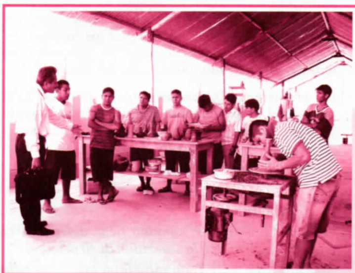
Trabajo en cerámica. Penal Río Seco en Piura

En este sentido, la gestión penitenciaria en general debe regirse por criterios estrictos de transparencia, apertura y monitoreo independiente; lo que no significa que deba existir permisividad absoluta en el ingreso de personas o grupos que aspiren a realizar tareas de monitoreo en las cárceles. Sino que implica, en primer lugar, que aquellas autoridades cuyas funciones y mandatos establezcan el deber de monitorear la situación de las personas privadas de libertad o la tutela de sus derechos fundamentales (p.ej., fiscales, jueces de ejecución, defensores del pueblo, procuradores) los ejerzan de manera efectiva; y por otro lado, que no se impongan restricciones arbitrarias al ingreso de terceras personas u organizaciones que realizan trabajos de derechos humanos en cárceles con apego a las normas legales y reglamentarias vigentes. 11