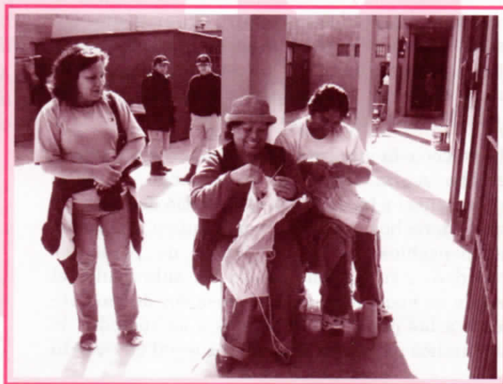
Tejedoras en el Penal de mujeres - Socabaya en Arequipa