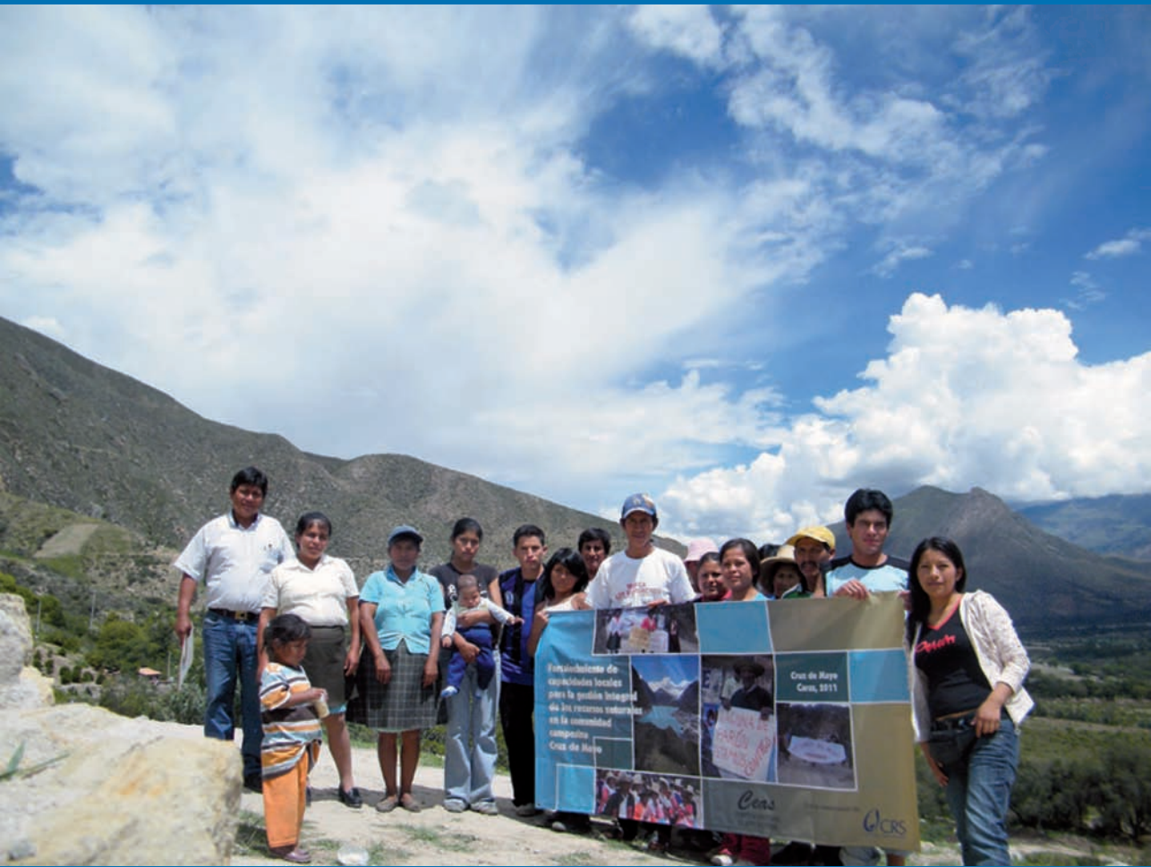
Acompañamiento y formación a comuneros - Sector Manchuria 2011