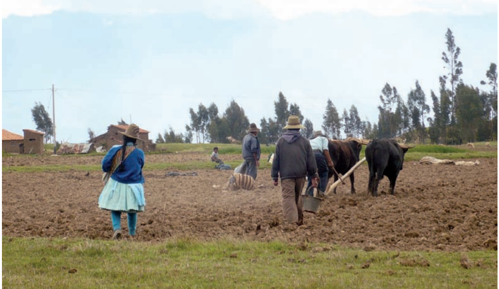
Siembra de papas, Pampacocha - noviembre 2008