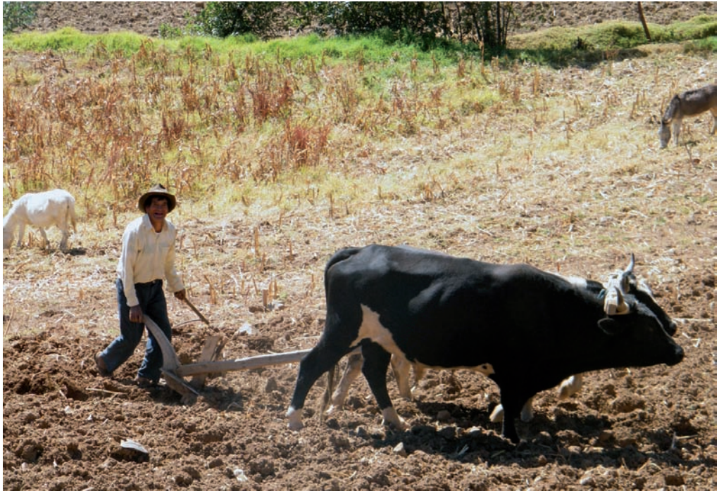
Arado de la tierra para el cultivo de productos - junio 2011

Se desarrolla una agricultura extensiva, básicamente para autoconsumo. Sólo en pequeñas cantidades sus productos son derivados al mercado para la venta, a través de las ferias que se desarrollan en la ciudad de Caraz. Entre los principales cultivos destacan los cereales, tales como: Maiz, trigo, cebada, papa, arveja, haba, chocho, quinua, kiwicha, olluco, oca, mashua. Las hortalizas, tales como: Lechuga, vainita, col, cebolla china, betarraga, rabanito; y en las frutas, tales como: Naranja, zarzamora, durazno, paca y palta.