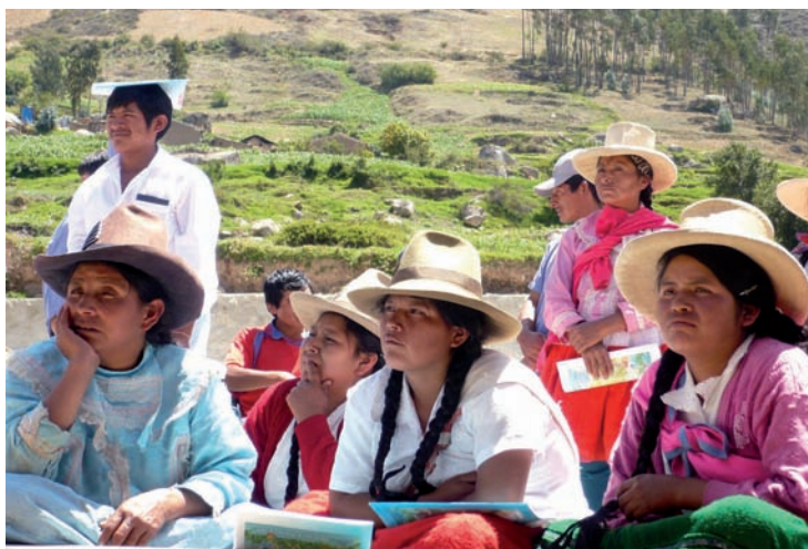
Taller de capacitación en el sector Llacshu, octubre 2008