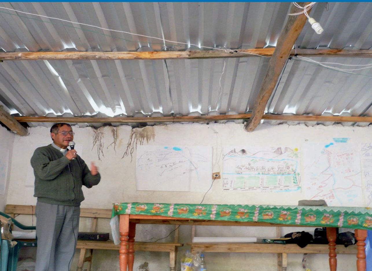
Siempre contamos con el apoyo de Mons. Eduardo Velásquez Tarazona, Obispo de Huaraz. Octubre 2008