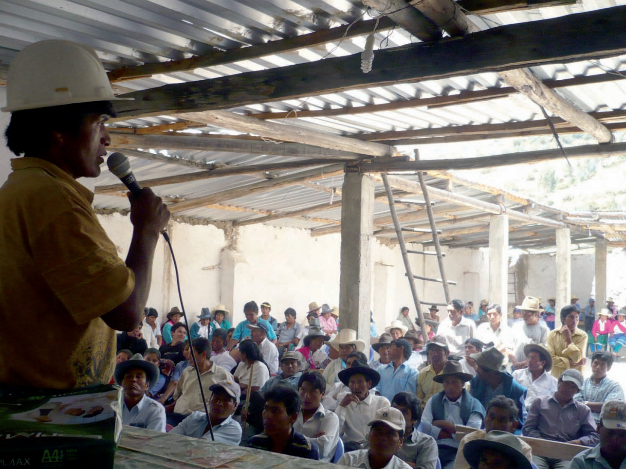
Asamblea general de la comunidad campesina Cruz de Mayo , toma de acuerdo para la defensa de la laguna Parón, agosto 2008

Es así que el 29 de Julio del 2008 , se da inicio a la recuperación de la laguna Parón, la misma que es custodiada por la comunidad campesina Cruz de Mayo en coordinación con organizaciones e instituciones locales, organizados a través del “Frente de Defensa de la laguna Parón y del Medio Ambiente”, acción llevada a cabo para que el gobierno central a través de sus órganos competentes resuelva el conflicto por el bienestar de la población afectada y la soberanía territorial de la Nación. Más de 5000 personas desfilaron hacia esta laguna para defenderla, pues, su espejo de agua se encontraba muy disminuido. De acuerdo a versiones de los pobladores, se llegó a realizar descargas superiores a 8 m 3 /s y tal como menciona la población, la laguna se encontraba como “ Un charco de agua ”.