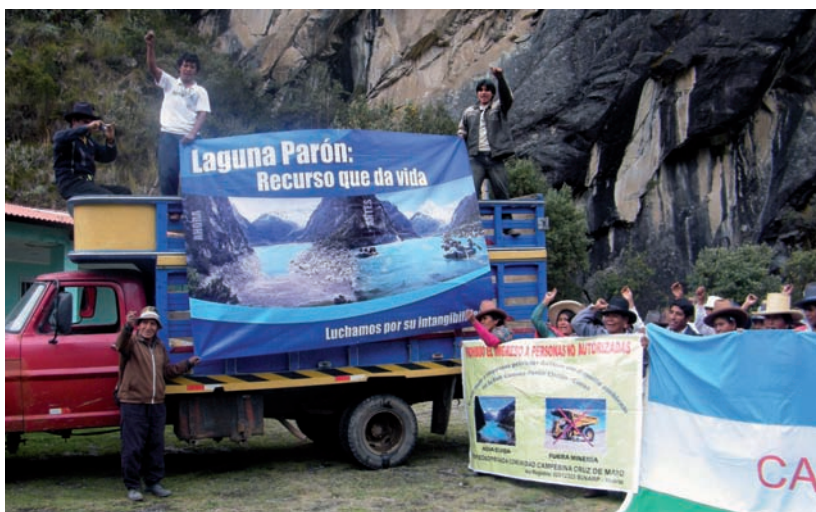
Reportaje sobre la laguna Parón, Panamericana Televisión, Canal 5 - noviembre 2011