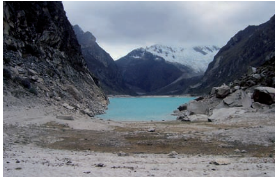
Laguna Parón deprimida, Agosto del 2008

A partir del 29 de julio del 2008, el “Frente de Defensa de la laguna Parón y el Medio Ambiente” asumen la custodia y recuperación de la laguna Parón, que en coordinación con los actores involucrados, deciden sobre el caudal de descarga para satisfacer la demanda de los usuarios, sin causar escasez ni descarga desmedida de las aguas, es decir en forma sostenible y bajo la lógica de protección de un área natural protegida.