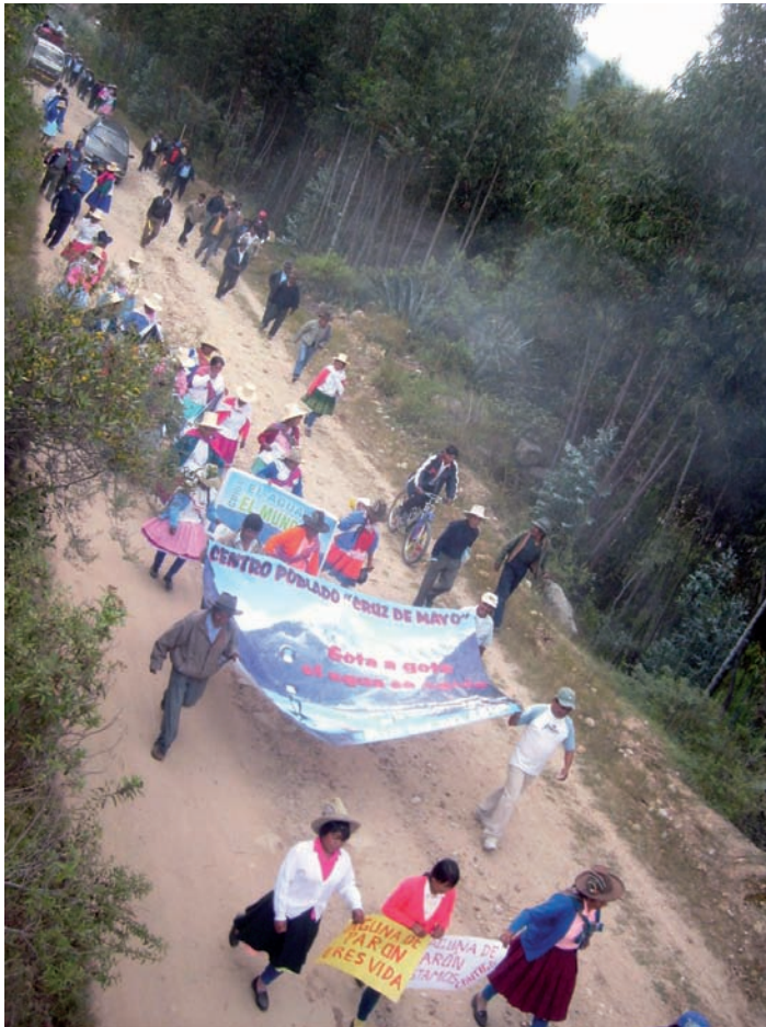
Desplazamiento de comuneros y comuneras para la recuperación de la laguna Parón

Esta custodia y defensa se prolongó por más de un año y medio (29 de julio del 2008 hasta 20 de enero del 2010), cuando se revierte la propiedad de la laguna Parón a nombre del Estado. En este lapso, no faltó el maltrato y la discriminación a los más afectados -la comunidad campesina- quienes poco a poco lograron tener una mayor actoría social.