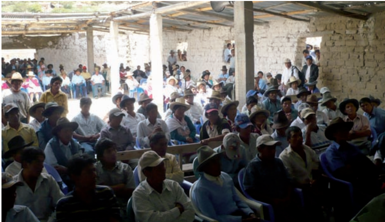
Asamblea general de los comuneros - Huauya 2009

La empresa Duke Energy Egenor, fue sancionada por OSINERGMIN, mediante resolución de Gerencia General N° 257-2005-OS/GG, por incumplimiento del cronograma de inversiones contenidos en el Programa de Adecuación y Manejo Ambiental (PAMA), en consecuencia se puso en riesgo a la comunidad campesina Cruz de Mayo y a toda la población caracina, tanto por la contaminación de las aguas al sobrepasar los límites de descarga de las aguas como por la escasez de agua para el riego.