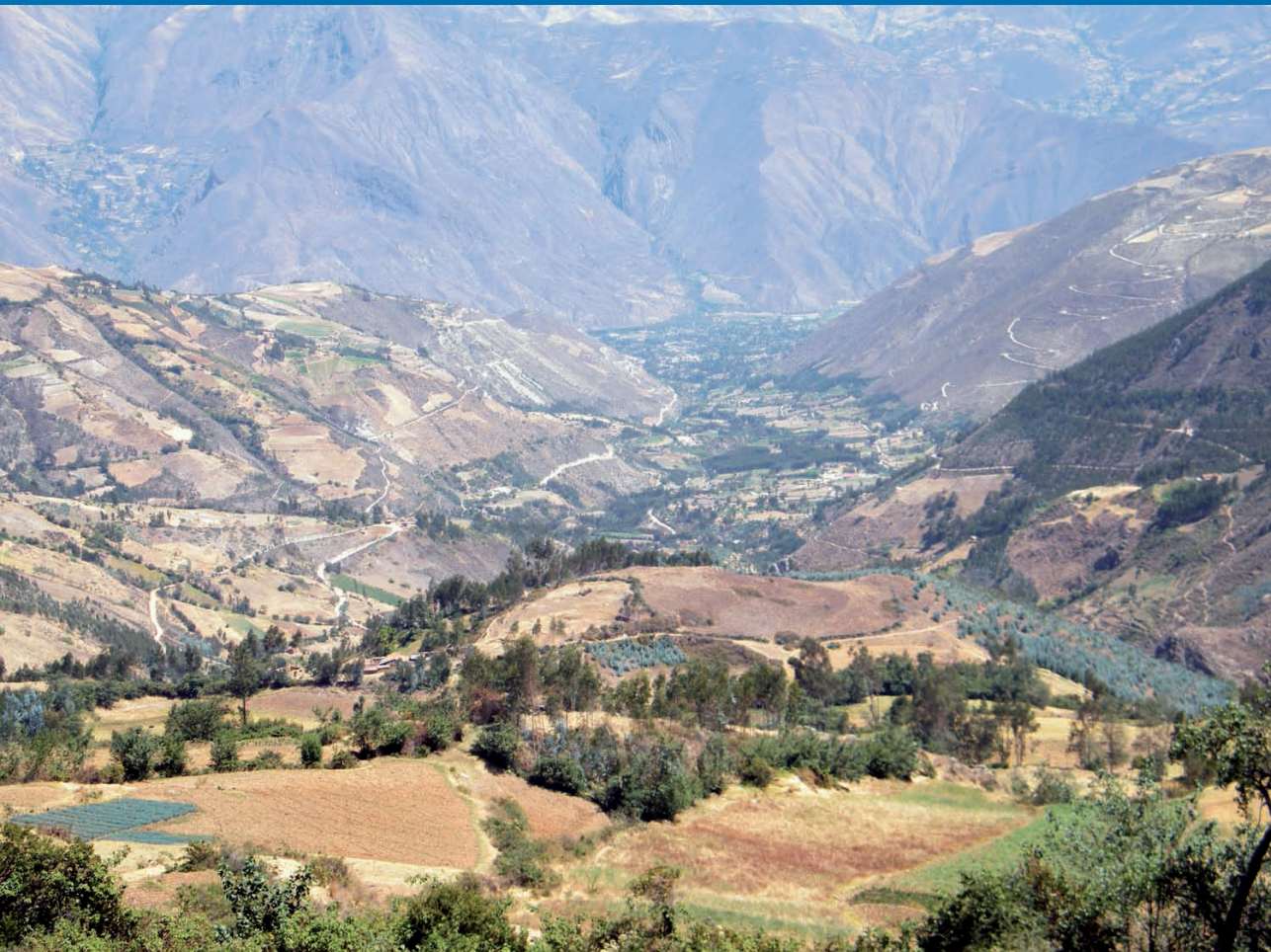
Vista panorámica de la sub cuenca Parón Llaullán - octubre 2011