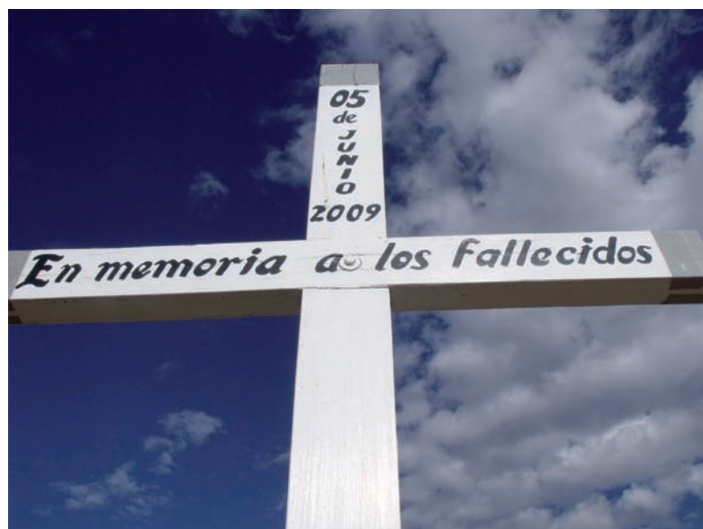
En memoria de las víctimas del 5 de junio del 2009 en la denominada “Curva del Diablo”

El 12 de junio de 2009, el Poder Judicial abre proceso penal por los sucesos ocurridos en el lugar denominado “Curva del Diablo”, ubicado en el distrito El Milagro, provincia de Utcubamba. Los delitos comprendidos en este proceso penal son: homicidio calificado, lesiones graves, atentado contra los medios de transporte de servicio público, motín y contra la tranquilidad pública.