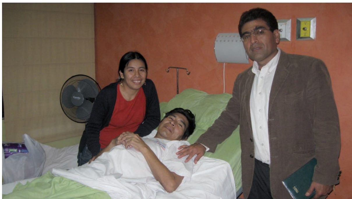
Santiago Manuin Valera un impacto de bala le perforó el intestino en 8 lugares