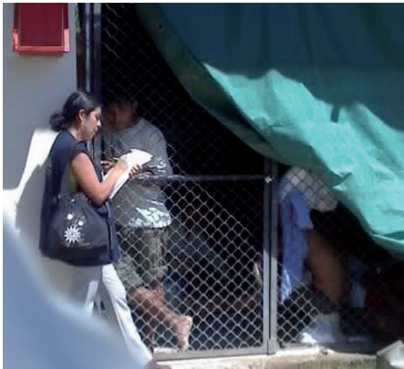
Abogados del Vicariato y CEAS atendiendo a detenidos en el Cuartel "El Milagro"

Como resultado de la represión de la Policía, hubo más de 120 personas detenidas, las cuales fueron ubicadas preliminarmente en el Cuartel Militar del Ejército Peruano "El Milagro", Unidad de Seguridad de Estado de Chiclayo, Comisaría de Utcubamba y Comisaría de Bagua.