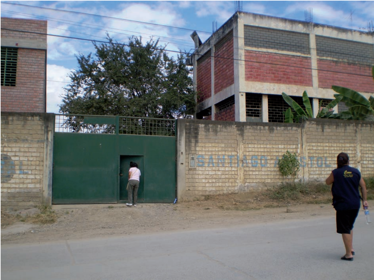
Foto CEAS: Centro Pastoral Santiago Apóstol de Utcubamba albergó a 726 indígenas, también se garantizó alimentación

Tomado de Defensoría del Pueblo: Informe de Adjuntía 006-2009.