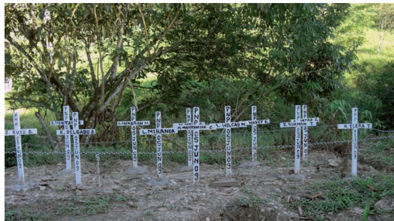
En memoria de nuestros hermanos policías fallecidos en la "Estación 6"